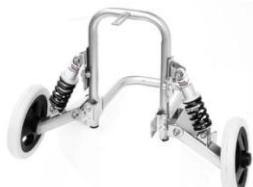
Société Reha Trans

Avant tout achat, nous vous conseillons de vérifier la compatibilité avec le diamètre de vos roues et la place dont vous disposez sur la roue arrière pour l'installation des stabilisateurs.