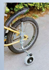
Société TFH France